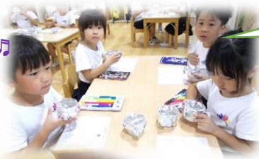
野菜の匂いクイズ!