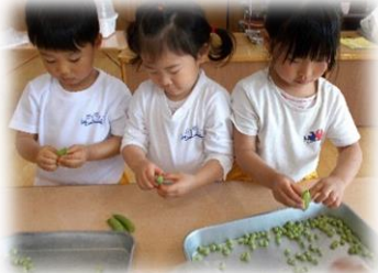
グリーンピースの皮むきです♪