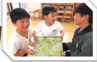
そろ豆たくさんむけたよ!!